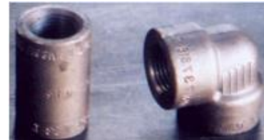
Elbow, Tee, Coupling